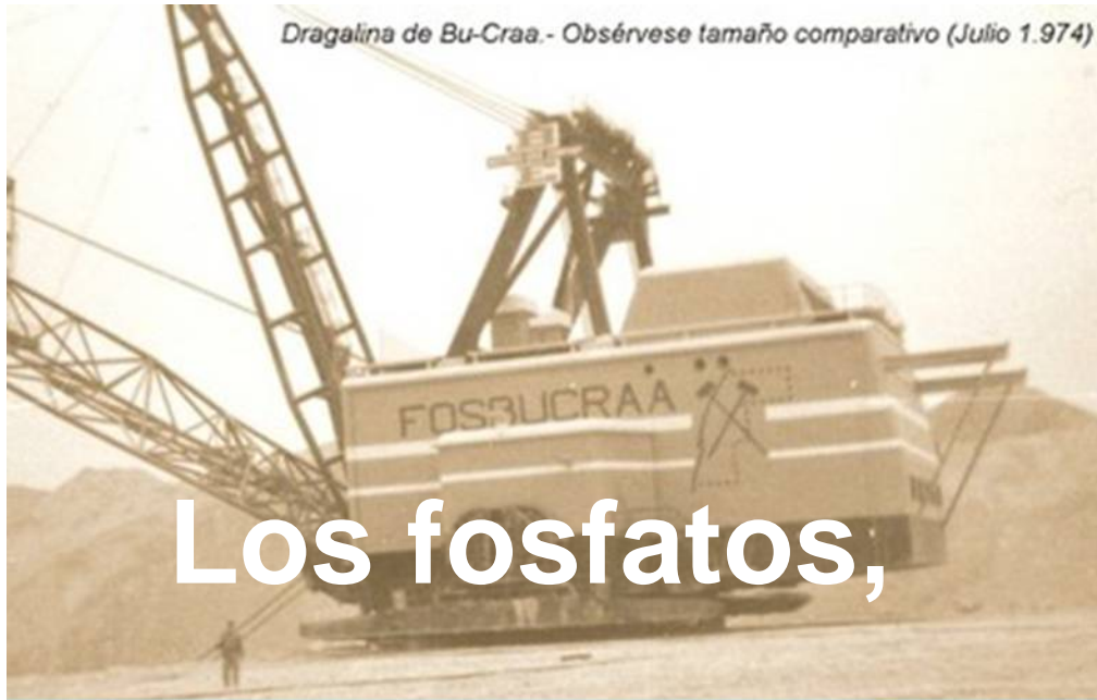
Dragalina de Bu-Craa.- Obsérvese tamaño comparativo (Julio 1.974)